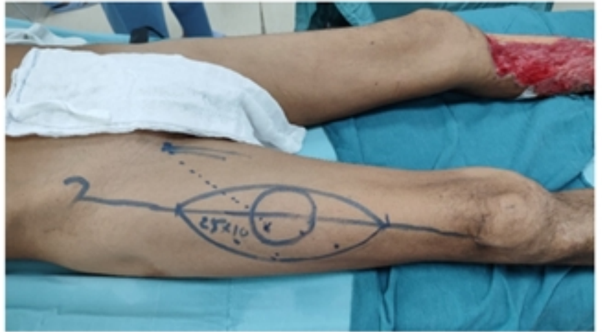
Thiết kế vạt