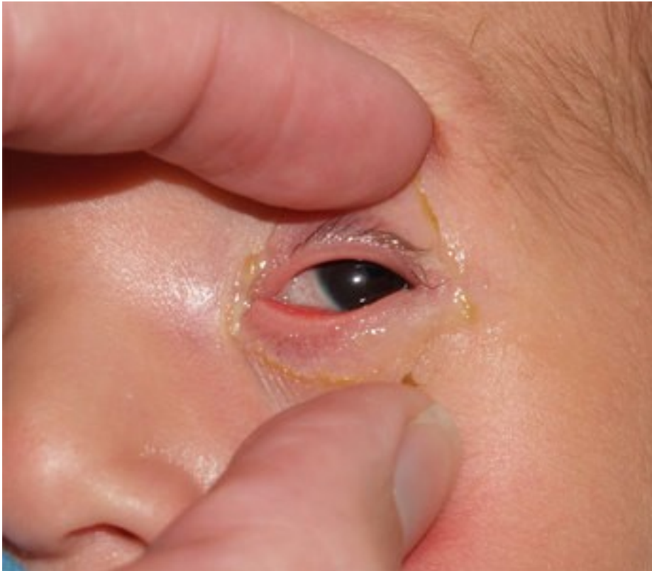
Hình 3: Tắc nghẽn ống dẫn nước mắt bẩm sinh mắt trái

Thứ năm, 01 Tháng 9 2016 13:39 - Lần cập nhật cuối Thứ năm, 01 Tháng 9 2016 13:46