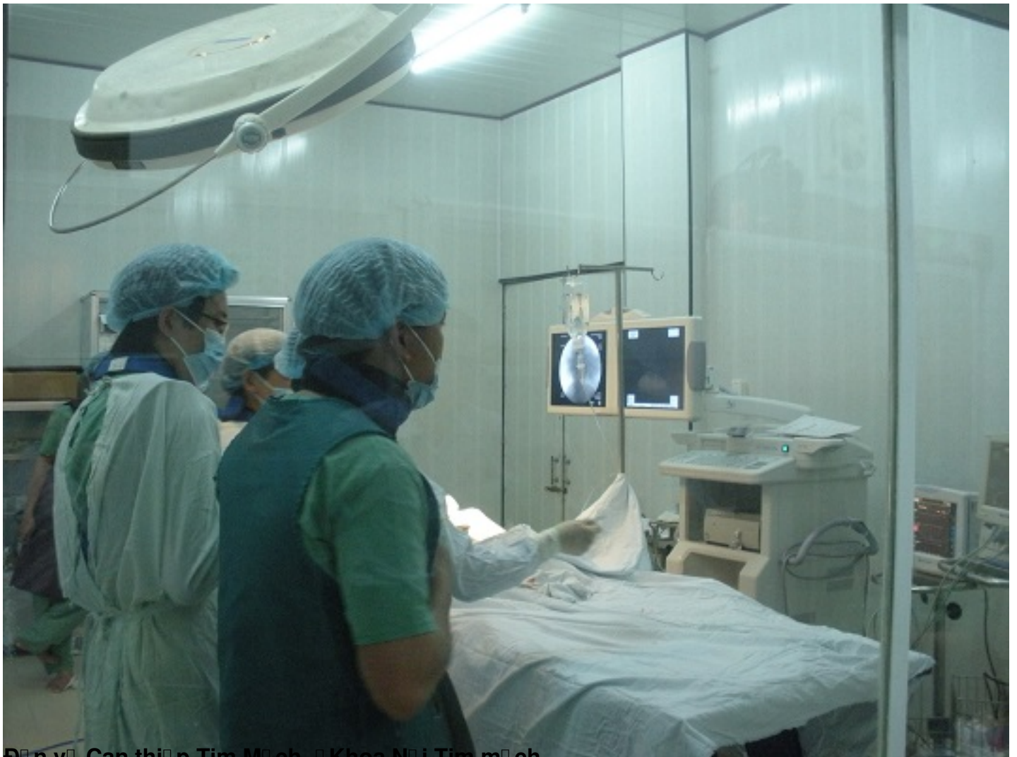
Đón vãn Kỹ thuật Can thiệp Tim Mạch - Khoa Nội Tim mạch